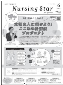
『ナーシング・スター』6月号 で詳しくご紹介しています。